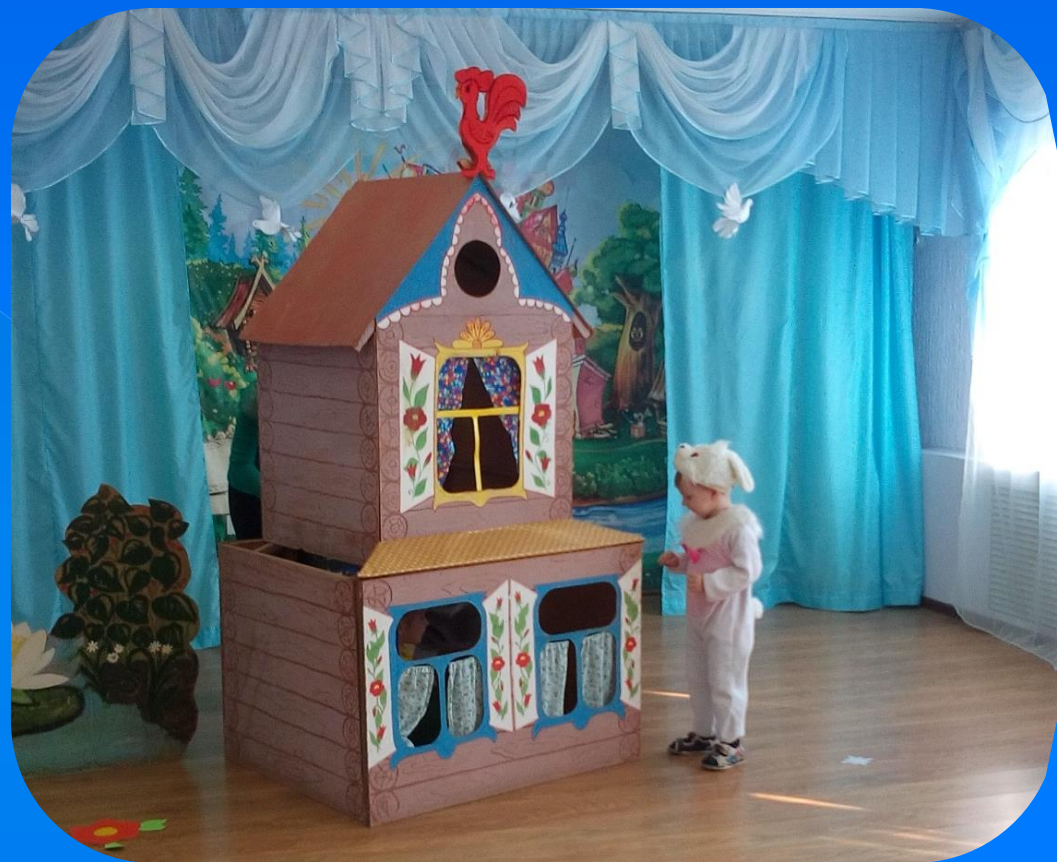
Стучится зайчик ...