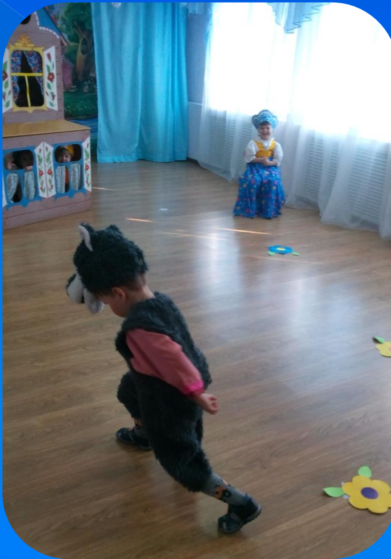
Идет волк - зубами щёлк...