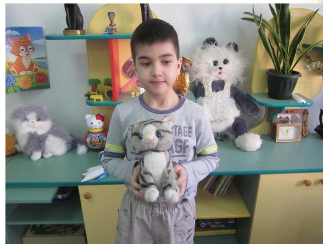
«Европейский полосатый кот»