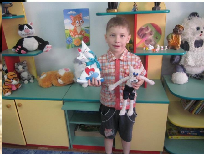
«Ангорская белая кошка»