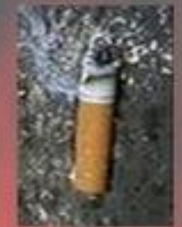
Непогашенная спичка или окурок