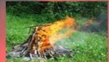
Не потушенный костёр