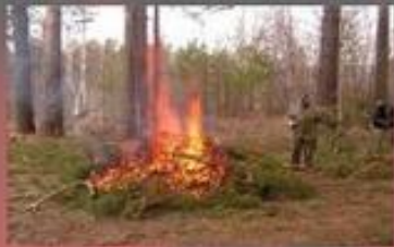
Сжигание лесозаготовителями порубочных остатков